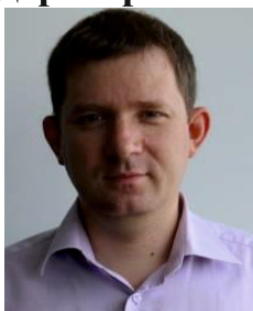
Денис Сергеевич Зуев, проректор Казанского государственного медицинского университета