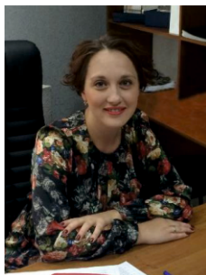
Виноградова Юлия Владимировна, директор Департамента по молодежной политике, социальным вопросам и развитию системы физкультурно-спортивного воспитания Казанского федерального университета