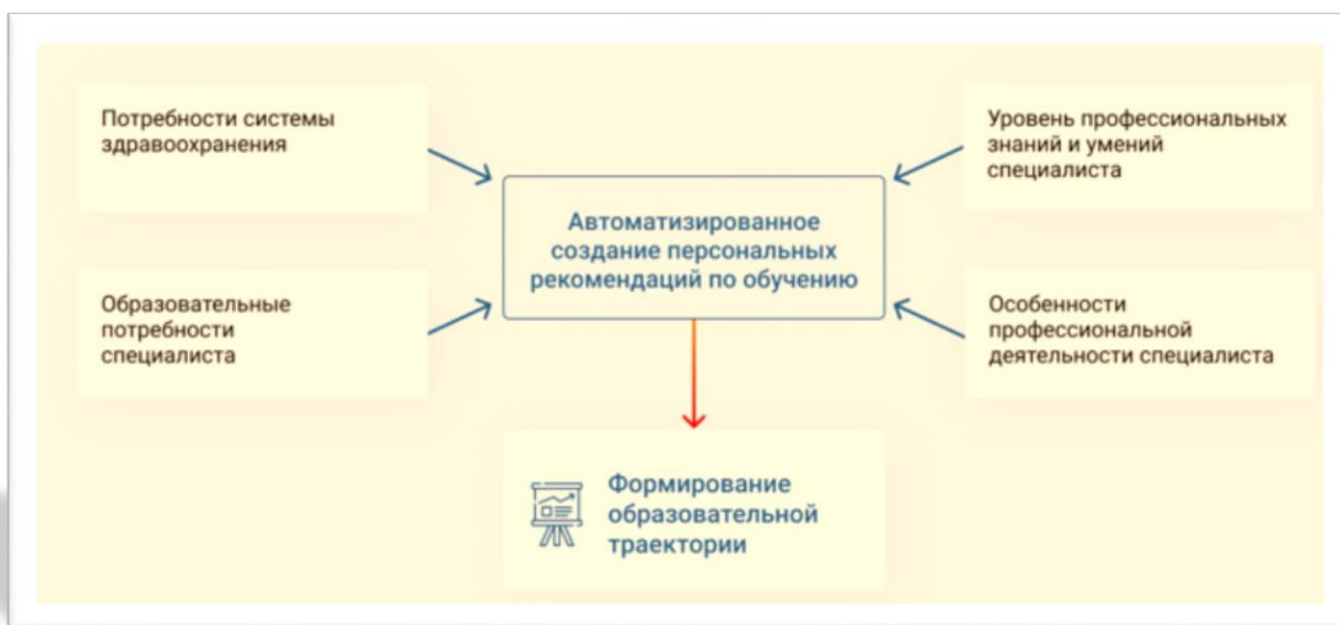
Рис. 4. Формирование индивидуальной образовательной траектории на портале НМО

Проблема качества образовательных программ рассмотрена в исследовании Г.Х. Романенко и А.А. Стремоухова [94]. По мнению авторов, формирование образовательной траектории медицинского специалиста должно основываться на критериях качества как отдельных образовательных программ, так и образовательного процесса в целом: соответствие федеральному государственному образовательному стандарту по специальности, профессиональному стандарту по специальности/должности, клиническим рекомендациям и их доказательной базе.