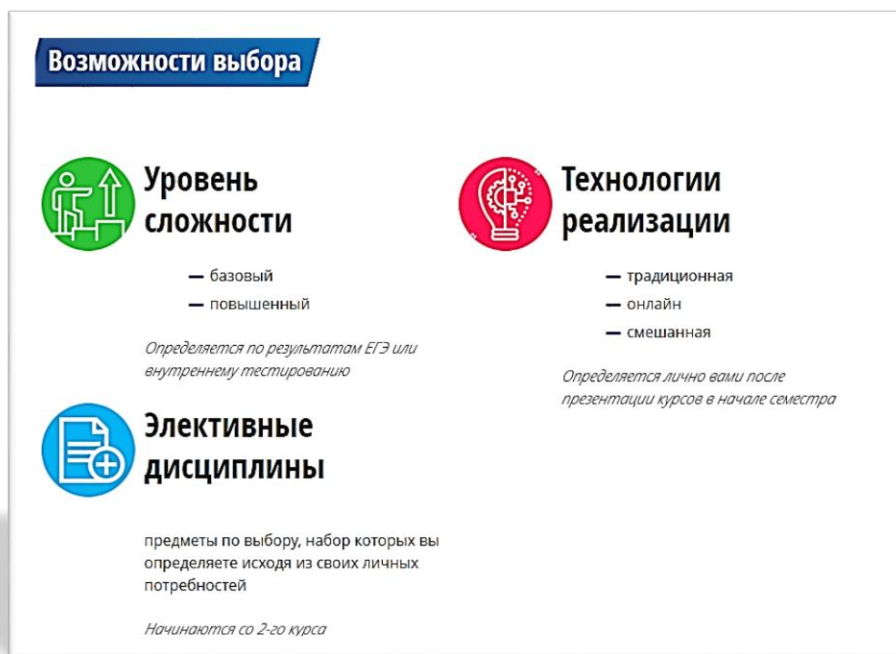
Рис. 3. Возможности индивидуализации обучения

Выбор дисциплин реализуется через личный кабинет. На первом этапе предлагается список, можно также выбирать курсы университетов-партнеров. Студенты выбирают. Если менее 20 человек выберут дисциплину, то она не реализуется. В результате составляется уточненный список. На втором этапе студенты записываются на выбранную дисциплину, на 3-м этапе составляется гибкое расписание. При составлении расписания студенты объединяются не только в академические группы, но и в учебные команды, что увеличивает возможности коммуникации.