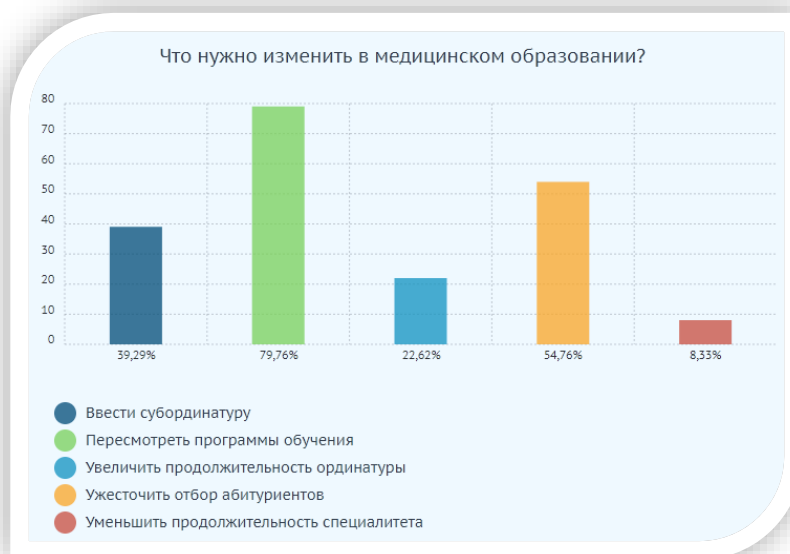
Рис. 2. Результаты ответов на вопросы анкеты о медицинском образовании