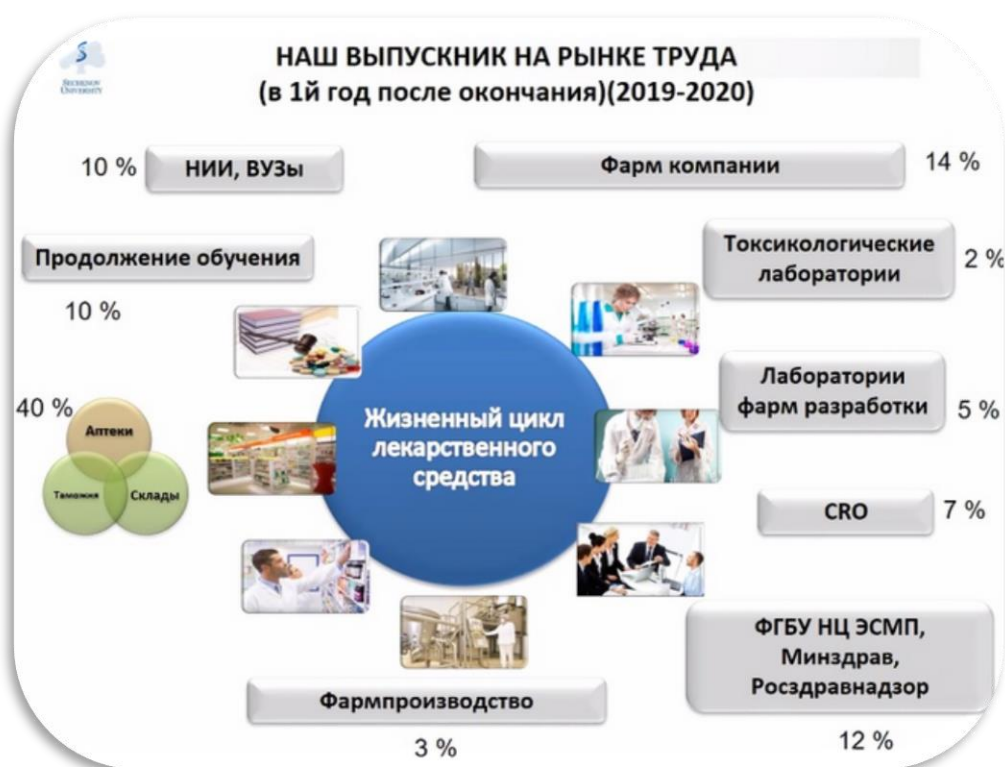
Рис. 5. Распределение деятельности выпускников в зависимости от жизненного цикла лекарственного средства (по материалам Сеченовского университета)

Выпускники фармацевтических вузов идут работать в НИИ, фармацевтические компании, лаборатории, на заводы, склады и в аптеки (рис. 6) [103].