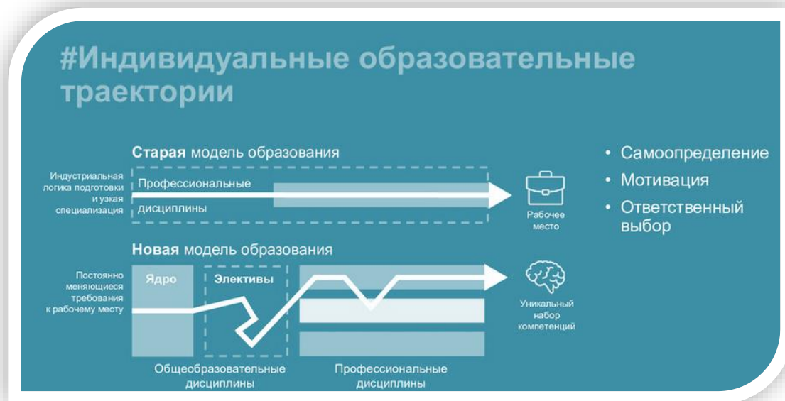
Рис. 2. Сравнение старой и новой модели образования в ТюмГУ

В новой модели образования изменилась жизнь не только студентов, но и преподавателей, которым пришлось осваивать навыки работы с гетерогенными группами и взаимодействовать с коллегами, иногда даже в высококонкурентной среде. Внедрение системы оценивания преподавателя студентами, используемой как в ядерной программе, так и в элективных дисциплинах дало важную обратную связь самому преподавателю и стало наглядным индексом для студентов, которым предстоит выбрать себе элективы.